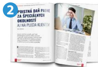
FOTO • 2400 x 1470 pixelov, 300 dpi POČET ZNAKOV S MEDZERAMI • 4800