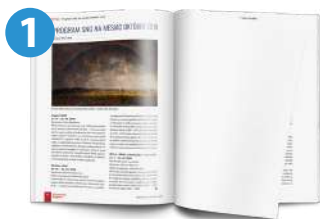
FOTO • 2400 x 1470 pixelov, 300 dpi POČET ZNAKOV S MEDZERAMI • 2400